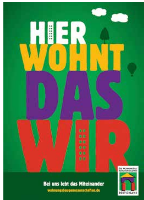
Ausdruckstark: Zwei von vielen Motiven der Kampagne

Wohnfühlen bei der GWG Wandern Sie sich also nicht, wenn Sie die starken Kampagnen-Motive der Marketinginitiative im Rahmen unserer Bauprojekte wahrnehmen. Als Signet dient ein stilisiertes Haus aus bunten Bauklötzen auf grünem Grund. Selbstverständlich werden wir aber weiterhin unsere eigene Wort-Bild-Marke „GWG - WOHN-FÜHLEN“ beibehalten und in unseren Farben rot und blau in Neuss und Kaarst präsent bleiben.