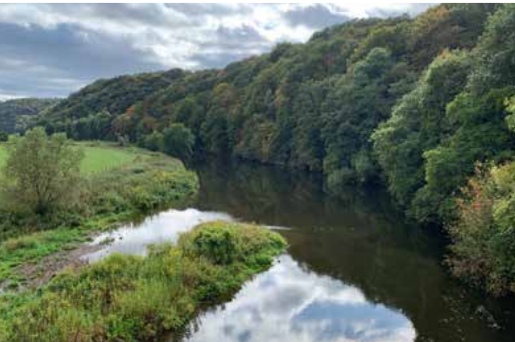
Links: Das ehemalige Kloster Merten dient heute als Alten- und Pflegeheim. Rechts: Idylle an der Sieg