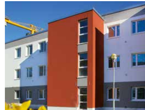
Seit Mai fertig für ein neues Wohngefühl.

Da es während der Corona-Krise immer wieder zu Änderungen hinsichtlich der Öffnungszeiten und Erreichbarkeiten der GWG-Zentrale und der Hauswartbüros kommen kann, sind aktuelle Hinweise hierzu immer auf der Internetseite der GWG unter www.gwg-neuss.de abrufbar.