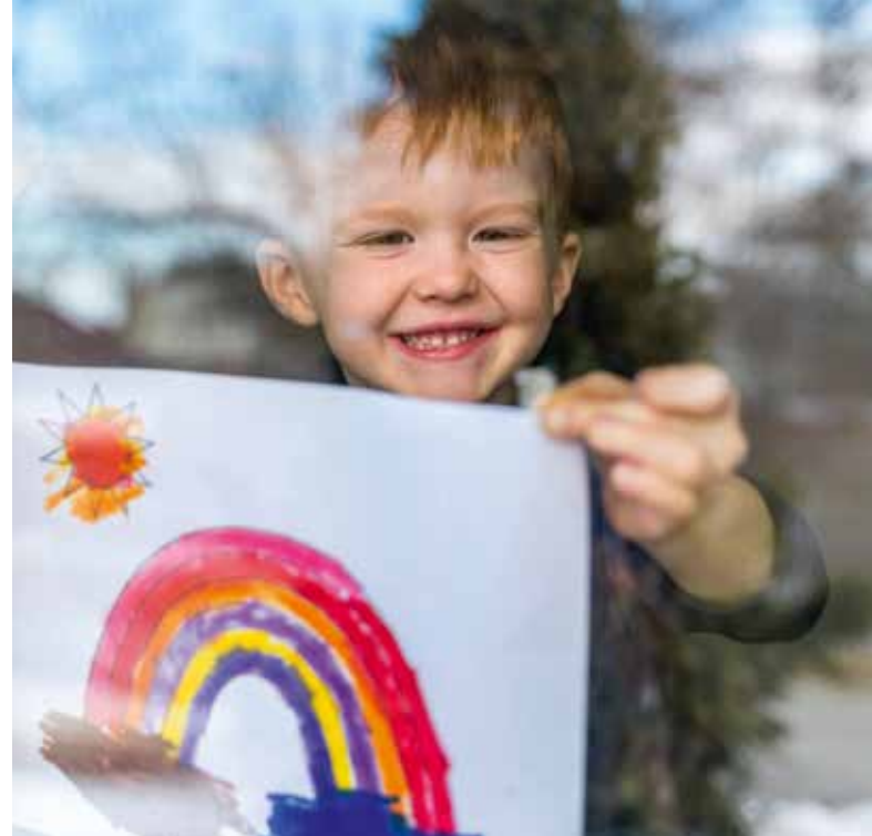
Regenbogenbilder in vielen Fenstern sollen in Pandemiezeiten Mut machen

Miteinander aufeinander Acht geben In unserer GWG wissen wir, dass ein Computer keinen persönlichen Kontakt ersetzen kann – auch, wenn Video-Telefonie über alle Altersklassen hinweg ein gutes Mittel ist, sich zu sehen und miteinander schöne Momente zu erleben. Das haben wir gerade während der Aus-